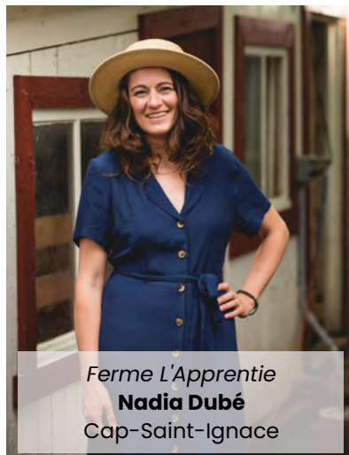
Ferme L'Apprentie Nadia Dubé Cap-Saint-Ignace