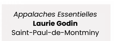
Appalaches Essentielles Laurie Godin Saint-Paul-de-Montminy