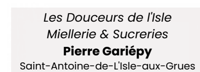
Les Douceurs de l'Isle Miellerie & Sucrieries Pierre Gariépy Saint-Antoine-de-L'Isle-aux-Grues