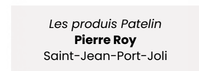
Les produits Patelin Pierre Roy Saint-Jean-Port-Joli