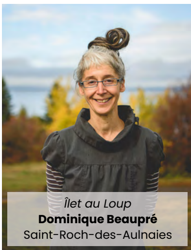
Îlet au Loup Dominique Beaupré Saint-Roch-des-Aulnaies