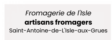
Fromagerie de l'Isle artisans fromagers Saint-Antoine-de-L'Isle-aux-Grues