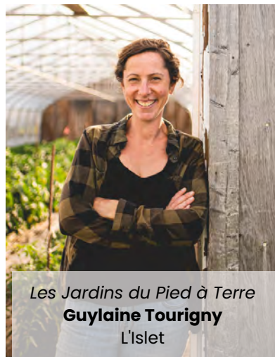
Les Jardins du Pied à Terre Guylaine Tourigny L'Islet