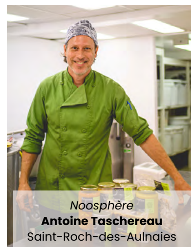
Noosphère Antoine Taschereau Saint-Roch-des-Aulnaies